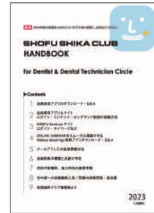
「SHIKA CLUB HANDBOOK」