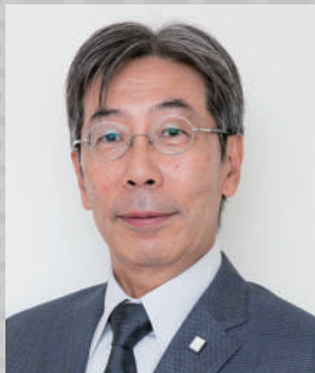
大塚歯科クリニック

また、デジタルとの親和性も高い、シンプルなおペレーションを採用した新しいシステムについて、デモを交え解説させていただきます。