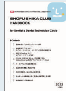
「SHIKA CLUB HANDBOOK」