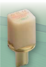
セラスマート レイヤー

歯科切削加工用レジン材料 セラスマートレイヤー 管理医療機器 231AKBZX00004000 セラスマート プライム 管理医療機器 302AKBZX00007000 セラスマート300 管理医療機器 228AABZX00116000