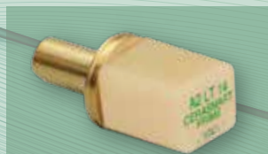
セラスマート プライム