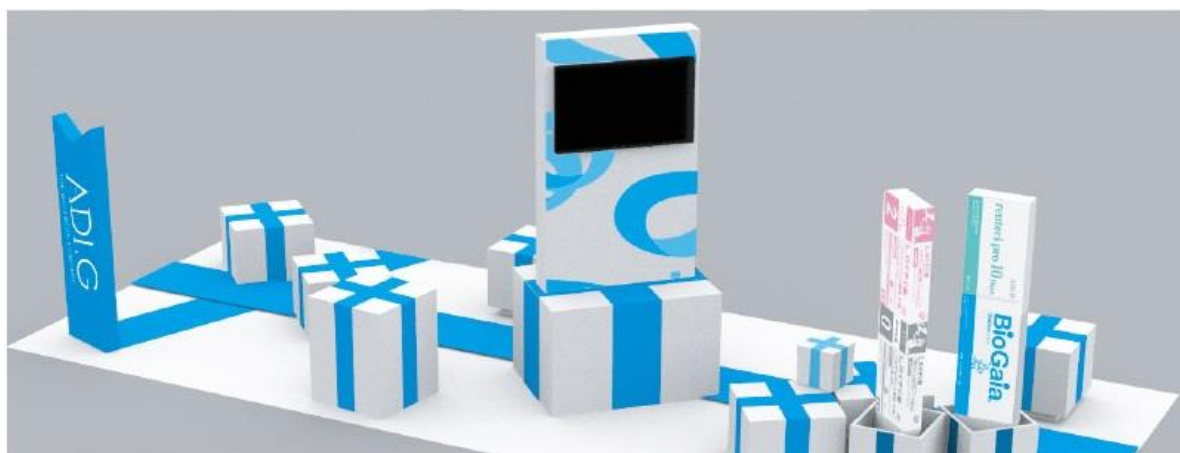
今回のテーマは「GIFT」。ギフトボックスをイメージしたブースで最新の製品・サービスを紹介

歯科用医療関連製品の開発・販売を行う株式会社 ADI.G（読み：エイディアイドットジー、本社：神奈川県横浜市、代表取締役社長：浅野弘治）は、パシフィコ横浜で2020年1月12日、13日に開催される「第48回横浜デンタルショー」に出展します。当社の出展テーマは「GIFT（ギフト）」で、ギフトボックスをイメージしたブースに、歯科医院とお客様の結びつきを深めて歯科業界全体の活性化と発展に貢献する製品・サービスを展示します。また、ブース内では両日、水だけでみがける歯ブラシ「MISOKA PRO」、痛くない貼るはり「イオンQ」の体験会を開催するほか、話題の乳酸菌「ロイテリ菌」のサンプリング等も実施します。