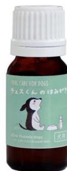
『チェスくんのはみがき』外箱とボトル